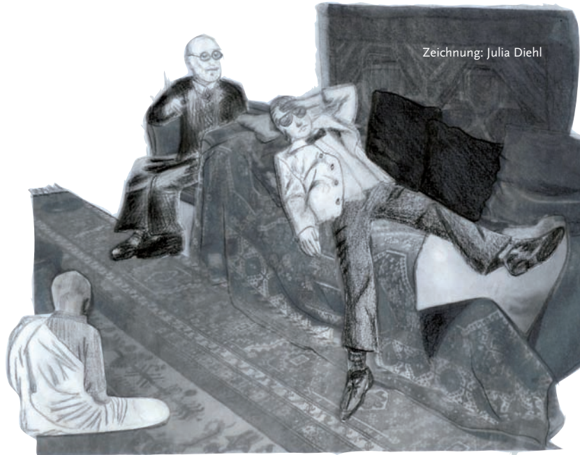
Zeichnung: Julia Diehl

Jene Aufstellung mit Freud, Falco und Buddha, aus der die Eingangsszene stammt, hat bei allen Beteiligten einen besonderen Eindruck hinterlassen. Nicht nur, weil wir als Seminarleitung uns mit den Teilnehmerinnen und Teilnehmern in Wien trafen und uns von der Authentizität des Wirkungs-