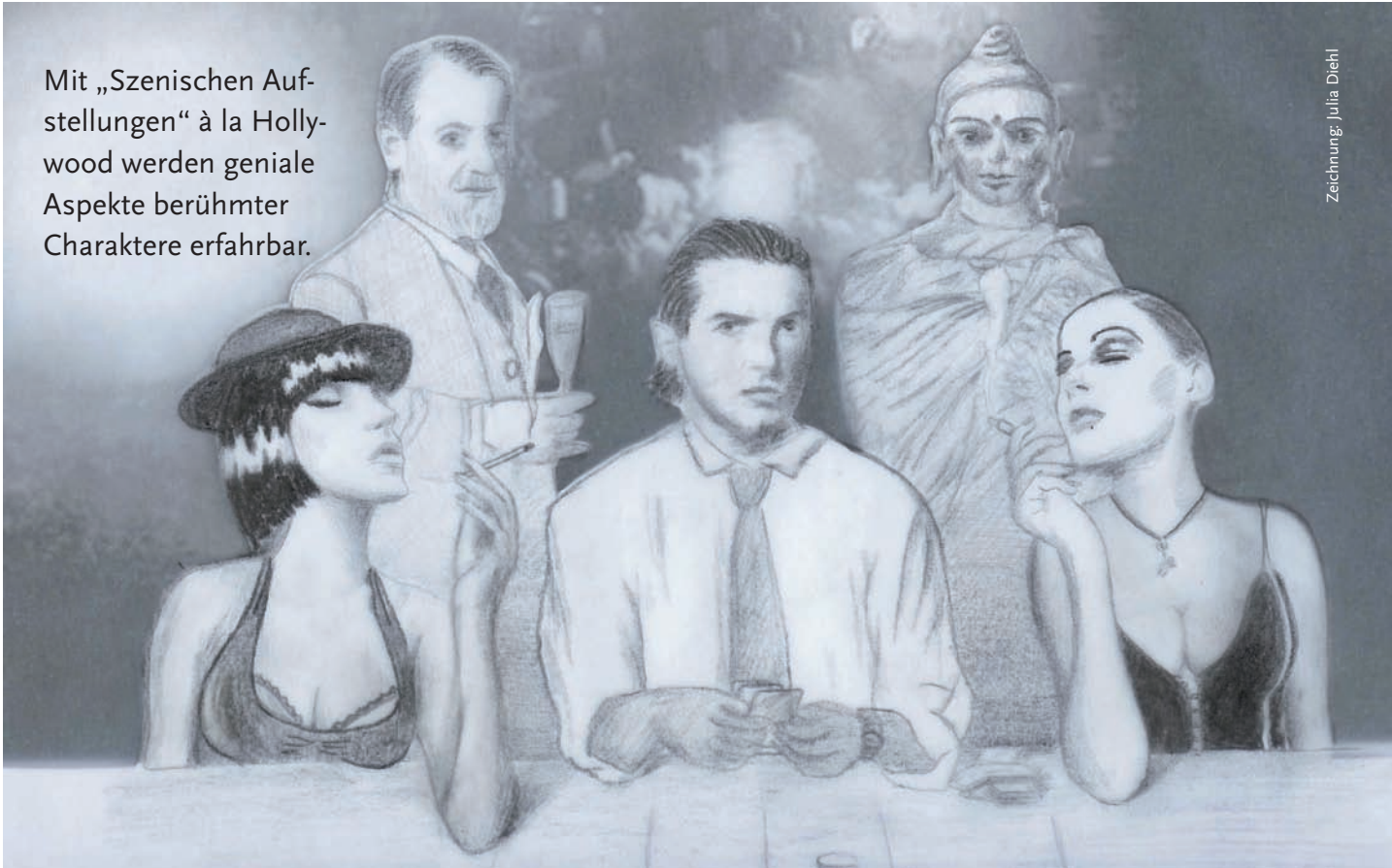
Zeichnung: Julia Diehl

Mit „Szenischen Aufstellungen“ à la Hollywood werden geniale Aspekte berühmter Charaktere erfahrbar.